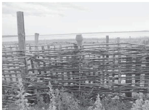
Рис. 14. Фрагмент плетня. Село Усть-Кормиха Волчихинского р-на, 2011 г.

Следы строительных традиций с использованием