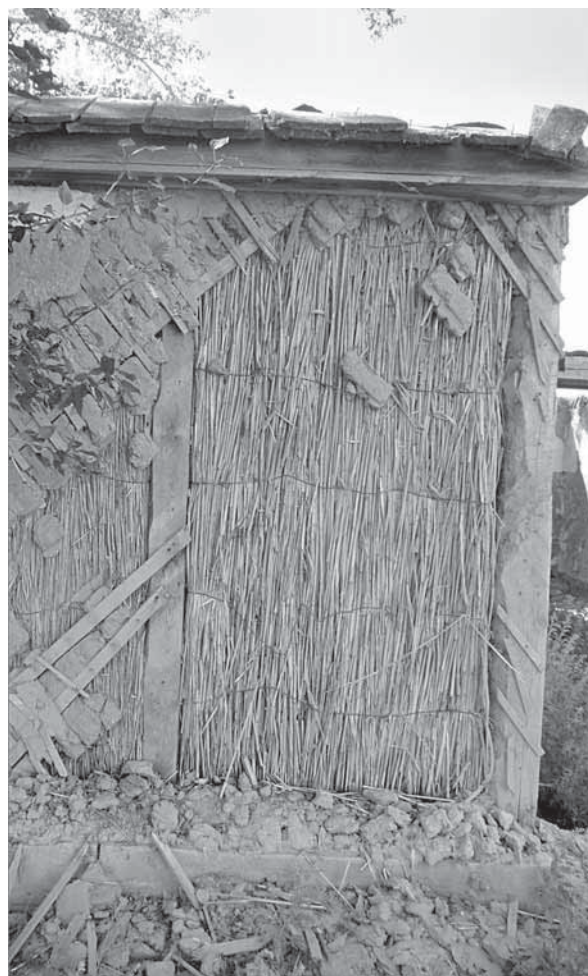
Рис. 18. Фрагмент пристройки камышитового штукатуренного дома. Село Бор-Форпост, 2011 г.

При этом можно говорить об установке определен-