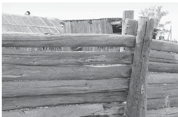
Рис. 12. Фрагмент забора из бревен с креплением «в столб». Село Усть-Кормиха, Волчихинский р-н.