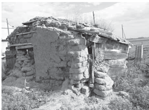
Рис. 3. Смешанный материал с использованием самана, кирпича, досок. Пос. Вавилонский Поспелихинского р-на, 2008 г.