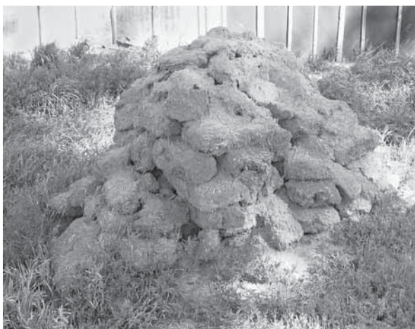
Рис. 7. Куча самана из разобранного дома. Пос. Николаевка Поспелихинского р-на, 2008 г.

храняются украинские, компоненты этнических культур.