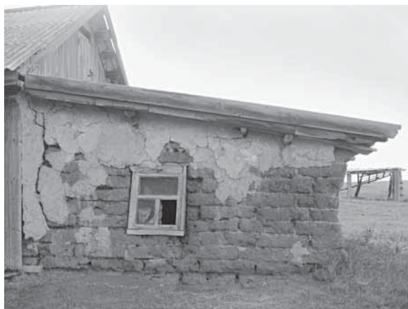
Рис. 5. Пристроенные саманные сени. Село Красноярка, Поспелихинский р-н, 2008 г.

хайловский, Кулундинский, Славгородский, Родинский, Бурлинский, Табунский, Ключевской и другие районы. Границу ядра составляют районы, протянувшиеся с севера на юг вдоль трассы Барнаул – Павловск – Мамонтово – Романово – Волчиха – Михайловка до Углов. Эти райцентры и сами районы являются периферией полиэтнического степного запада, где сохранились и полиэтнические и моноэтнические села, и память потомков переселенцев о своих корнях. Внутри этого ядра и его пограничья есть ареалы локального расселения украинцев, немцев, казахов, татар и смешанные поселения. Например, немецкие села преобладают на территории Славгородского и Кулундинского районов (совр. Немецкий национальный район) при наличии локального расселения немцев в других районах. Этническим ядром расселения украинцев является Родинский район, а также Романовский; казахов – Михайловский, Бурлинский районы, при наличии казахских поселений в Кулундинском районе (с. Кирей), Панкрушихинском районе (с. Кзыл-Ту); Угловский район (с. Бор-Кособулат, с. Павловка) и др. При этом в районах расселения казахов существуют и татарские (Беленькое Угловского района) и казахско-татарские села (с. Кирей Кулундинского района). Завершают переселенческую историко-этнографическую зону районы, расположенные вдоль Змеиногорского тракта Барнаул – Алейск –