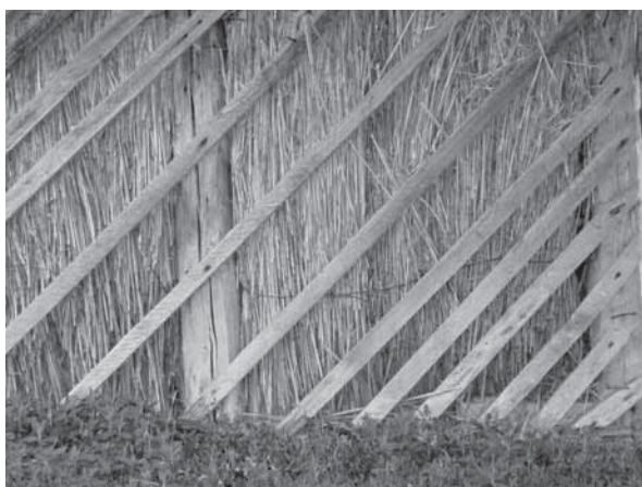
Рис. 10. Фрагмент стены под окнами камышитового дома с отпавшей штукатуркой. Видны щиты из камыша в обшивке. Село Мормыши, Романовский р-н, 2010 г.

тупали место украинцам или немцам или тем и другим вместе взятым. Так, немцы в Славгороде составляли 59,8% от общей численности населения, в Табунском районе – 48,6%, в Хабаровском – 28,4%, в Благовещенском – 17,6%, в Кулундинском – 15,1%, в Бурлинском – 12,7%. Украинцы в Родинском районе составляли 27,6%, в Бурлинском – 23,4%, в Табунском –