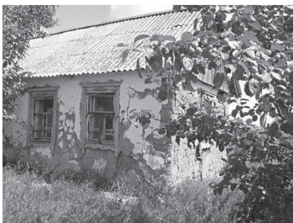
Рис. 2. Саманный дом. Село Николаевка, Поспелихинский р-н, 2008 г.