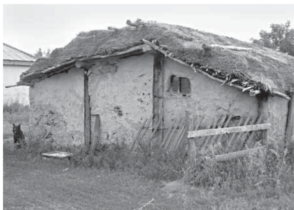
Рис. 4. Теплый хлев с использованием самана под соломенной крышей. Село Красноярка, Поспелихинский р-н, 2008 г.