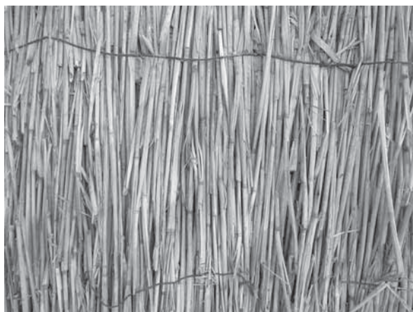
Рис. 17. Строительный щит из камыша. Село Бор-Форпост Волчихинского р-на, 2011 г.

Но остались и этнические традиции – например, «вечерины» в украинской традиции и «девичник» в русской традиции. В русском свадебном ритуале в старожильческих селах «девичник» отличался печальным контекстом: невеста прощалась со своей беззаботной жизнью, со своими родителями и подругами. Пели грустные песни и оплакивали прежнее время, обряд был насыщен причитаниями и плачами невесты. А вот «вечерины» у украинцев в украинских или смешанных русско-украинских селах проходили иначе, с шутками, прибаутками, с веселыми песнями. Невеста надевала лучший наряд, украшала голову венком с разноцветными атласными лентами, приглашала подружек, и они с песнями гуляли по селу.