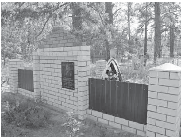
Рис. Казахское кладбище в с. Бор-Форпост

компромиссы в духовной сфере. В русско-казахских селах с немусульманскими народами граница взаимопроникновения отодвинута и менее проницаема. Проявляется это прежде всего в обрядах жизненного цикла, например в похоронном обряде, и существовании отдельных кладбищ у казахов-мусульман и христианских народов. Так, по материалам Волчихинской экспедиции 2011 г. зафиксированы отдельные кладбища казахов в Усть-Волчихе (проживало менее 10 человек), в с. Бор-Форпост (проживало около 20 человек), хотя численность казахов в этих селах невелика, тогда как у немцев, украинцев и русских этого района существовали совместные погосты. Примером является кладбище исчезнувшего села Осиновки Волчихинского района. Сохранившиеся надмогильные памятники показывают, что русские захоронения с