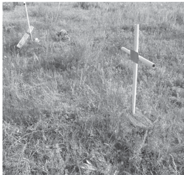
Рис. Кладбище исчезнувшего села Осиновка (Волчихинский р-н): захоронение русских (на переднем плане) и немцев (на заднем плане). 2011 г.

компромиссы в духовной сфере. В русско-казахских селах с немусульманскими народами граница взаимопроникновения отодвинута и менее проницаема. Проявляется это прежде всего в обрядах жизненного цикла, например в похоронном обряде, и существовании отдельных кладбищ у казахов-мусульман и христианских народов. Так, по материалам Волчихинской экспедиции 2011 г. зафиксированы отдельные кладбища казахов в Усть-Волчихе (проживало менее 10 человек), в с. Бор-Форпост (проживало около 20 человек), хотя численность казахов в этих селах невелика, тогда как у немцев, украинцев и русских этого района существовали совместные погосты. Примером является кладбище исчезнувшего села Осиновки Волчихинского района. Сохранившиеся надмогильные памятники показывают, что русские захоронения с