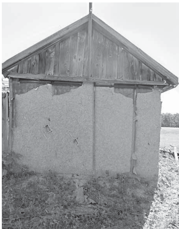
Рис. 16. Оштукатуренный дом из камышовых плит. Село Бор-Форпост Волчихинского р-на, 2011 г.