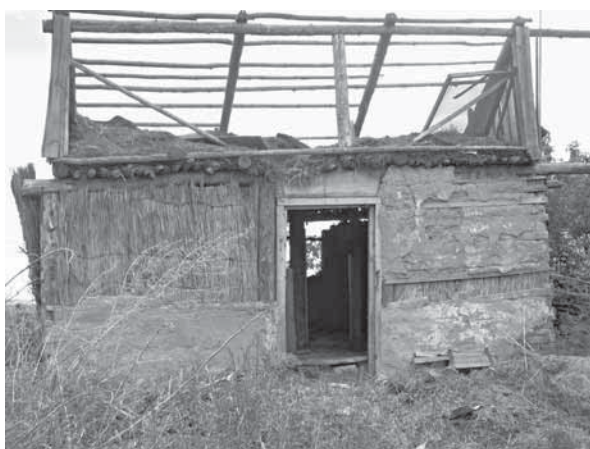
Рис. 9. Зброшенный камышитовый дом. Село Мормыши, Романовский р-н, 2010 г.