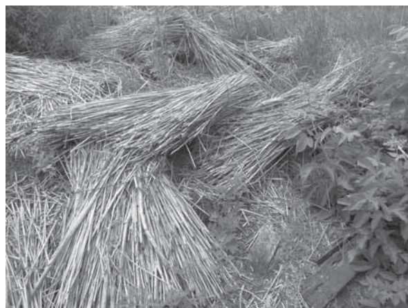
Рис. 11. Пучки камыша разобранного скотного помещения. Село Гуселетово, Романовский р-н, 2011 г.

тупали место украинцам или немцам или тем и другим вместе взятым. Так, немцы в Славгороде составляли 59,8% от общей численности населения, в Табунском районе – 48,6%, в Хабаровском – 28,4%, в Благовещенском – 17,6%, в Кулундинском – 15,1%, в Бурлинском – 12,7%. Украинцы в Родинском районе составляли 27,6%, в Бурлинском – 23,4%, в Табунском –