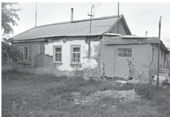
Рис. 1. Саманный жилой дом. Село Красноярка, Поспелихинский р-н, 2008 г.