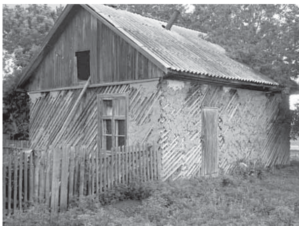
Рис. 8. Камышитовый дом. Село Мормыши, Романовский р-н, 2010 г.