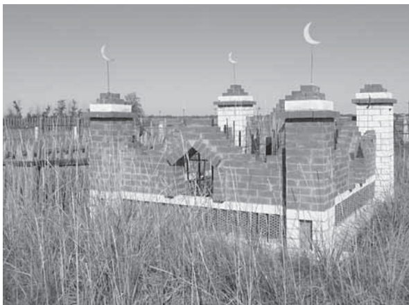
Рис. Казахское кладбище в с. Усть-Волчиха