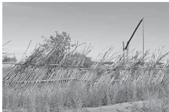
Рис. 13. Плетень. Село Усть-Кормиха Волчихинского р-на, 2011 г.